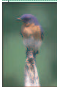
Merle-bleu de l'Est