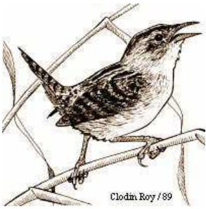
Clodin Roy / 89

Le Troglodyte à bec court est un résident vedette de l'île du Moine. Ainsi, chaque année des inventaires sont organisés pour évaluer la population et la fidélité de ce petit oiseau à son lieu de reproduction qu'est l'île du Moine. Pourquoi ce petit volatile suscite-t-il tant d'intérêt ? Parce qu'il est désigné comme une espèce vulnérable au Québec, c'est-à-dire qu'il a une répartition très limitée et localisée ce qui en fait un oiseau rare.